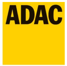
Erstellt von Jürgen Meier Sportleiter 1.AC Erlangen